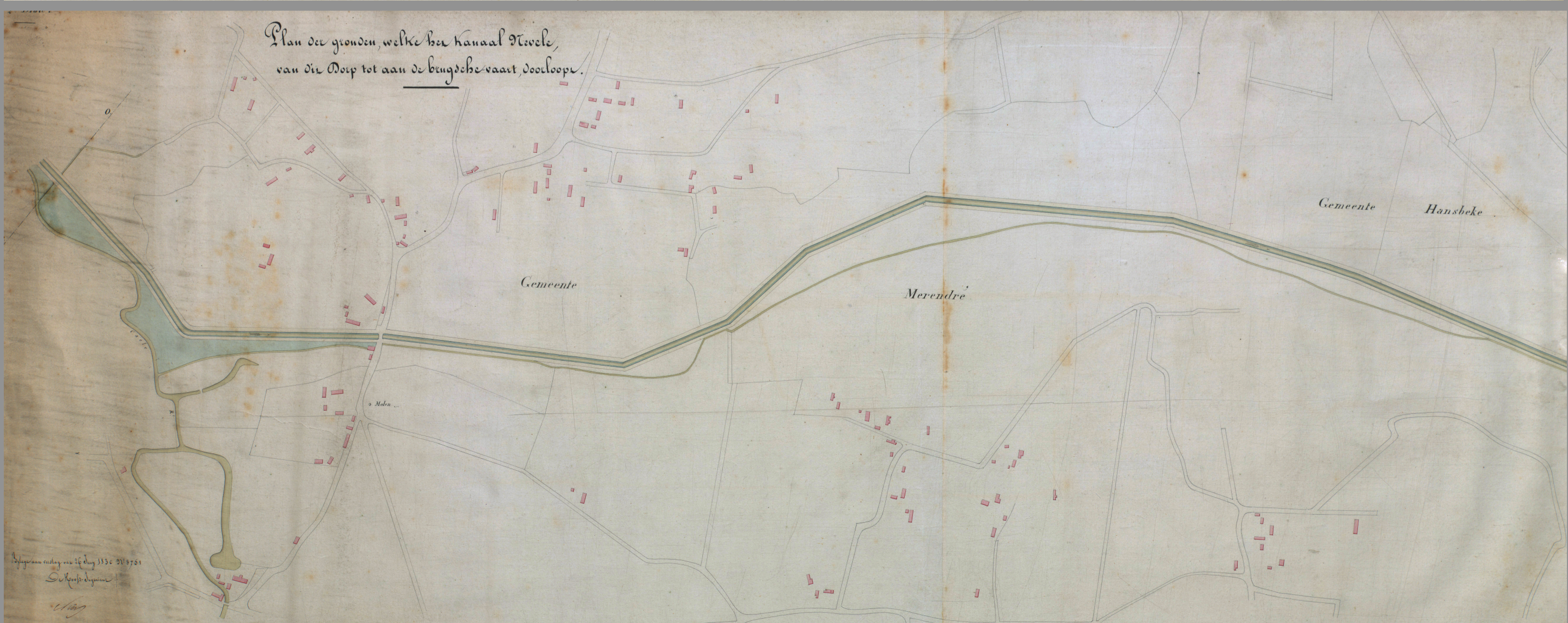
De opmetingen voor het hergraven van het Nevels Vaardeken in 1830 in Nevele, Landegem en Merendree