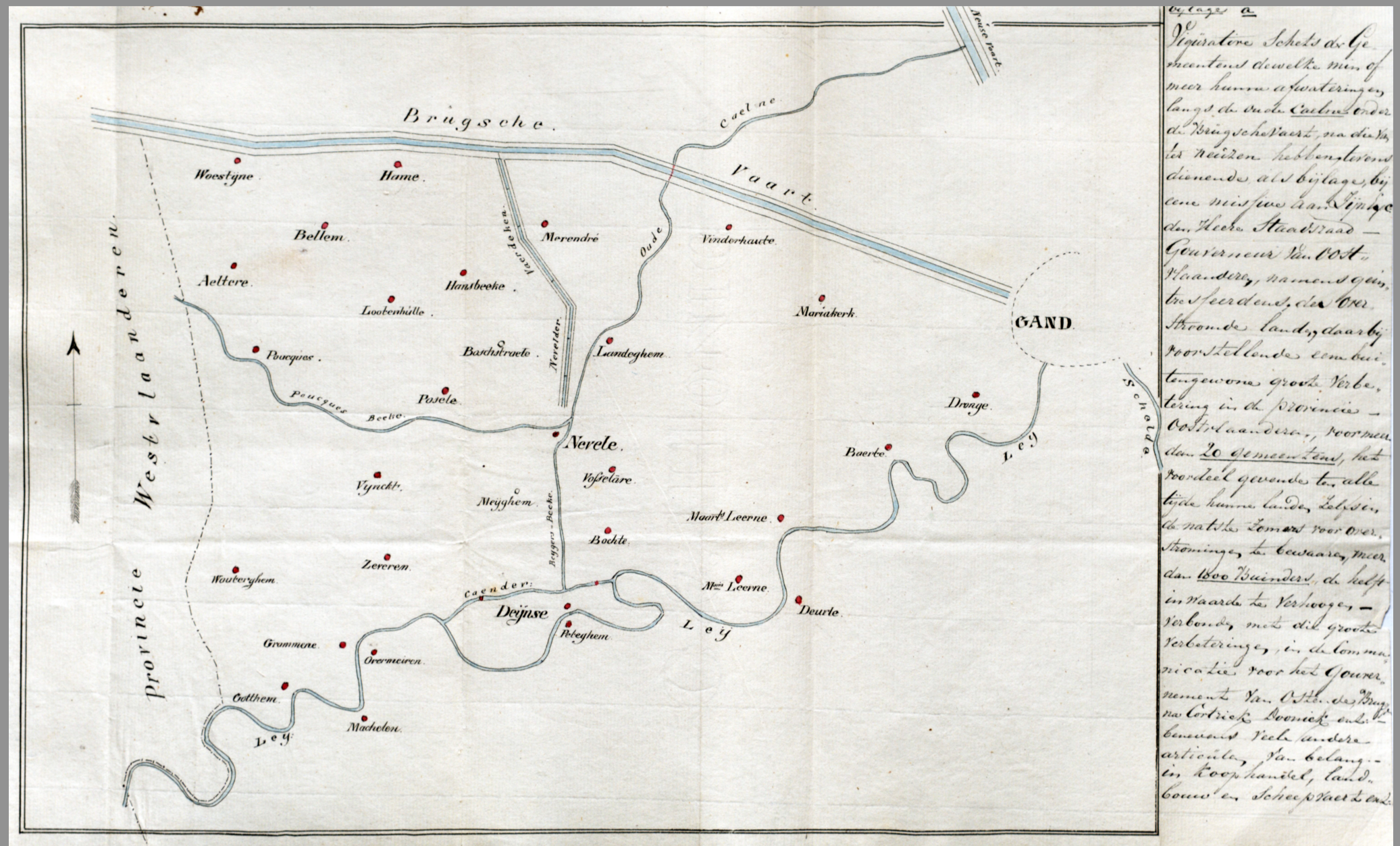
De waterwegen in Nevele en omgeving in 1829